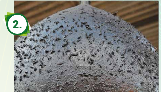
Een opgehangen zwarte dazenbal met Sticky Trap dazenlijm