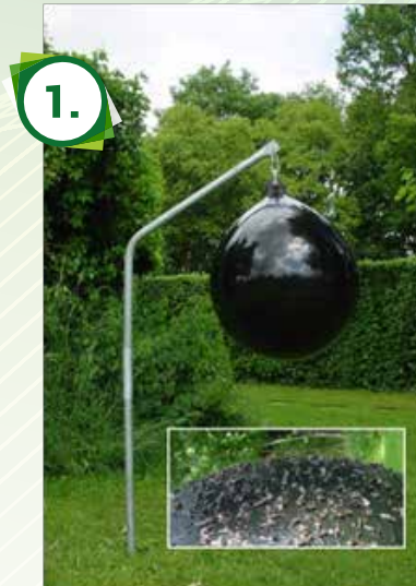
De Loer lijnval