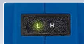
Anzeige Volumen (L) auf Druck (H) und Anzeige des Akkuladestands