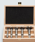
Forstner boren set 4100729