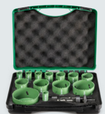
Bi-metaal gatzagenset 752177