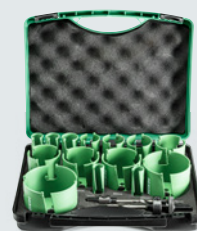
Hardmetaal gatzagen set 754255