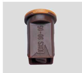
IDKS: Passende Air-Injektor Schrägstrahldüse IDKS