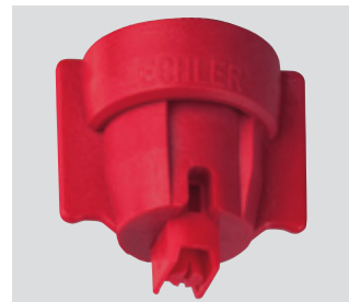
Empfehlung: MultiCap bietet der IDKT-Düse optimalsten Schutz vor Beschädigungen.