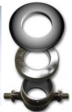
Issue Level 4