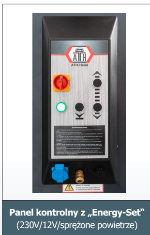
Panel kontrolny z „Energy-Set” (230V/12V/sprężone powietrze)