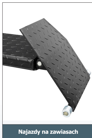
Najazdy na zawiasach